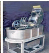
チゲナタビーター