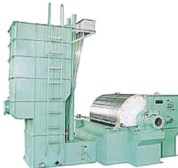
ジェットシリンダーパート