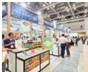
東京国際ギフト・ショー