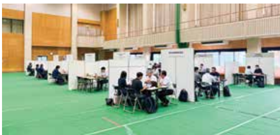
高知県技術の外商取引拡大商談会