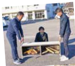
ベンチ使用イメージ