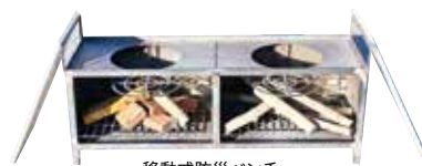
移動式防災ベンチ

普段は地域住民の憩いの場となり、災害時には座面を外せば、炊き出し用の「かまど」となる防災ベンチを構想。避難所など必要な場所へ持ち運べる「移動式」である点も大きな特長です。生徒は構想を固め、試作品の製作に取り組んできました。