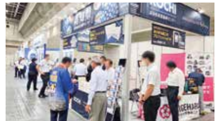
機械要素技術展の様子

出展後は、成約の可能性が高いバイヤーを招いたミニ展示商談会を東京・大阪・名古屋で開催するほか、バイヤーの現地視察にも対応するなどして、成約・販路拡大につなげています。