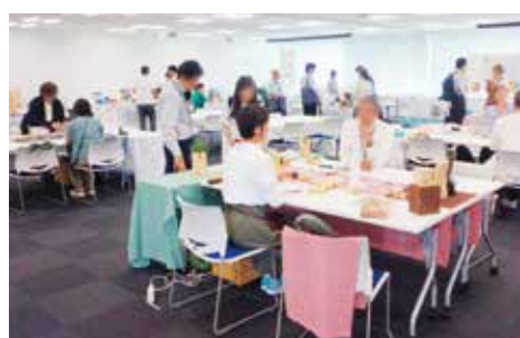
7/15 ギフト・ノベルティ(東京)