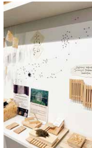
ショールーム展示(フランス)