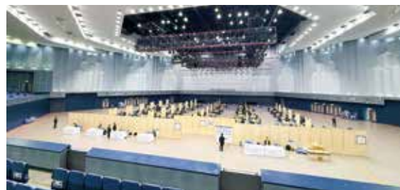
四国モノづくり合同商談会