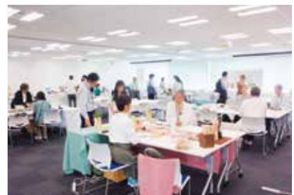
ミニ展示商談会(ギフト・ノベルティ)の様子

現地で得られた市場動向やバイヤーのニーズは県内企業の皆さまにタイムリーにお届けすることで、次の販路開拓や取組に活かされています。