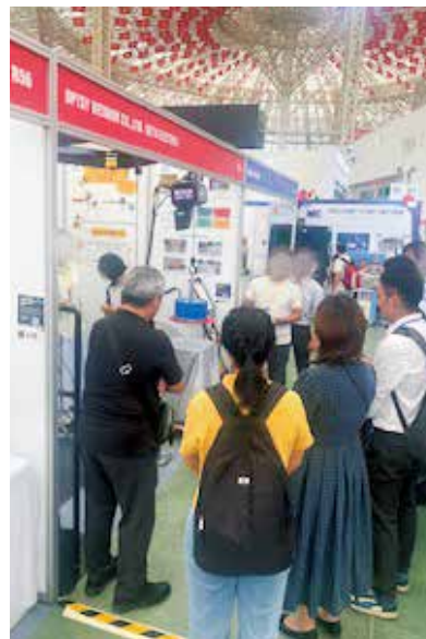
FBCアセアンものづくり商談会 2025(ベトナム)