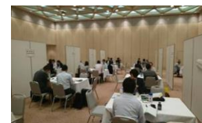
商談会実施 イメージ