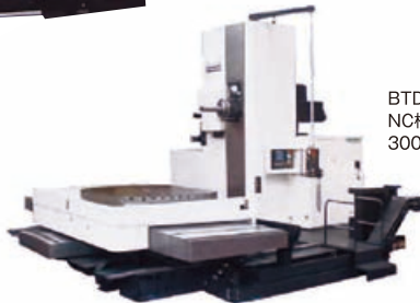
BTD-13F R22 NC横中ぐりフライス盤 3000×2300×1600