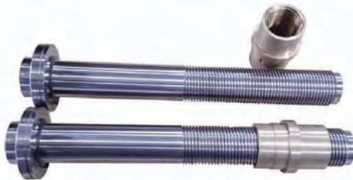
S45C (H) φ220x1030 (120台形2条ネジ"PI0リード"20) LBC4 φ165x210 (120台形2条ネジ"PI0リード"20)