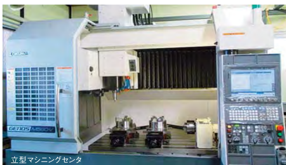
立型マシニングセンタ