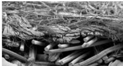
NA 超極細アクリル繊維不織布の断面