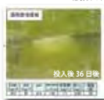
戸田第一スカイハイツ池 濁度値の低下