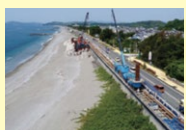
県都高知市沿い高知海岸の強化 全長約18km.このほか県内の沿岸各所で施工