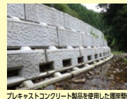
プラスチックコンクリート製品を使用した崖岸整備