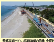
県東高知市沿い高知海岸の強化 全長約18km. このほか県内の沿岸各所で施工